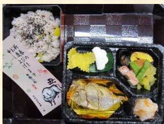
ご利用者様の お正月のお食事です